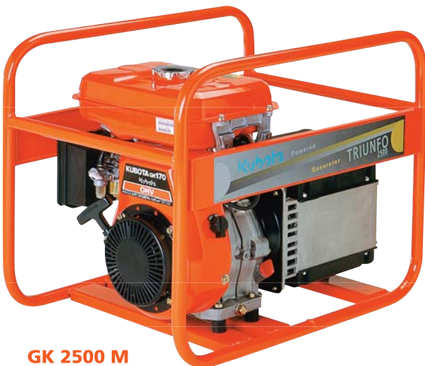
GK 2500 M