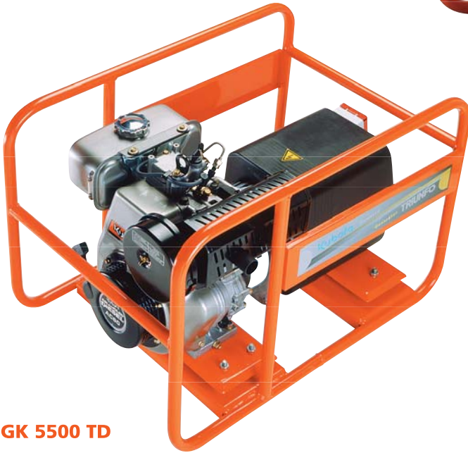
GK 5500 TD