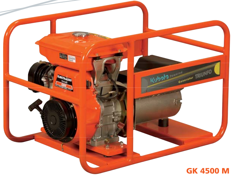
GK 4500 M