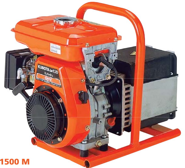
GK 1500 M